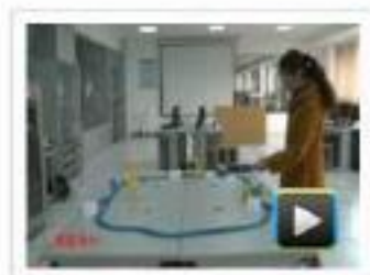
● 组建SDH环形网络 学校：常州信息职业技术学院 作者：谭花娜