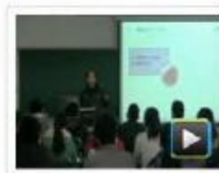
● 模板零件（孔系）的程序... 学校：常州信息职业技术学院 作者：王慧