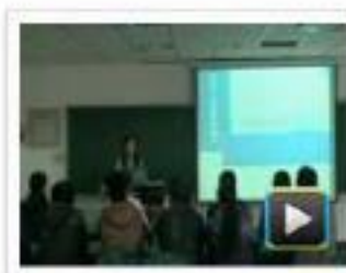
● “局部剖视图”的操作方... 学校：常州信息职业技术学院 作者：夏丽英