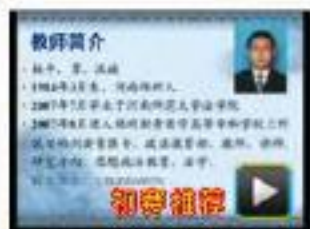
● 爱国主义与经济全球化 学校：郑州澍青医学高等专科学校 作者：杨平