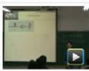
● 八段数码管的静态显示 学校：常州信息职业技术学院 作者：邓志辉