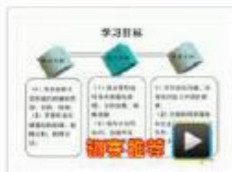
● 塞尔武凸轮轴/曲轴位置 学校：河源职业技术学院 作者：张兴贵