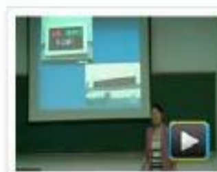
● LED数码管动态显示 学校：常州信息职业技术学院 作者：李征